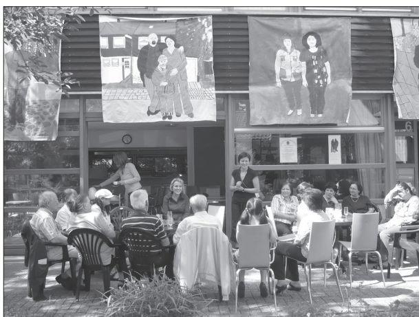
Abb. 1: Gemeinwesenarbeit braucht Raum, hier das „Haus der Zukunft“ in Bremen-Lüssum

Tandemmodells entgegengewirkt werden. Für die Aktivitäten vor Ort ist ein besonders qualifiziertes Team von Stadtteilentwicklern einzusetzen, das unterschiedliche Aufgaben und Funktionen für den Stadtteil wahrnimmt. Im Stadtteilbüro werden dabei gleichgewichtig die Kompetenzen des Beauftragten für Gemeinwesenarbeit (Sozialarbeit, Aktivierung und Organisation von Bewohnergruppen, Vernetzung im Stadtteil) und des für Planung Zuständigen (Darstellung von Projekten, Entwicklung von Planungsalternativen) zusammengeführt (vgl. Thies et al. 2009).