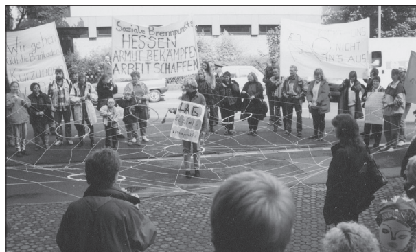
Abb. 3: Akteure vor Ort aktivieren und vernetzen

Die Wirtschaft als Interessengruppe und als Ressource ist bisher meist nur in ihrer öffentlichen Ausprägung präsent: Wohnungswirtschaft bzw. Eigenbetriebe sind im Blick. Es geht aber auch um die Einbeziehung der Wirtschaft als Mitbürger: als Sponsoren (Ortsidentifikation/Einbettung), als Träger der Kofinanzierung oder auch als engagierte Vertretung mit Reputation. Handlungs- und Politikstil sind bisher mehr oder weniger „kooperativ“: Wirtschaftsplanung steht Bündnissen für Familien, Bürgerstiftungen, Jugendplanung, Stadtplanung, Randgruppen (GWA) gegenüber. Ansätze der lokalen Beschäftigung gibt es im Bereich Schule/Jugend/Arbeit. Die Akteurskonstellationen sollten wirtschaftlich orientierte Entwicklungspartnerschaften und sozial orientierte Netzwerke der Quartiersverbesserung stärker zusammenbringen, um nachhaltig integrative Beschäftigungs- und Versorgungseffekte in den Stadtteilen erzielen zu können. Hier wäre auch ein verstärktes Engagement von freien Trägern der Wohlfahrtspflege sowie von Kirchen und Glaubensgemeinschaften wünschenswert. Die Wohnungs- und Immo-