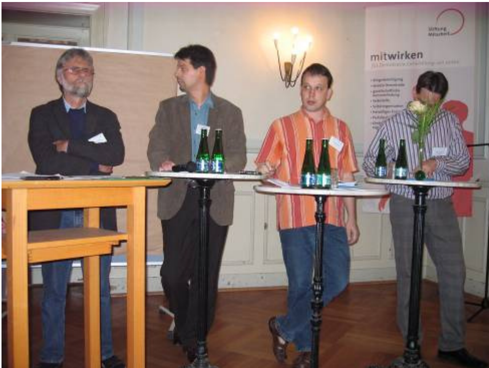
Berichtersteller: Jürgen Maier (Workshop 1), Frederick Groeger-Roth (WS 2), Uwe Lummitsch (WS 4) und Tobias Habermann (WS 3)