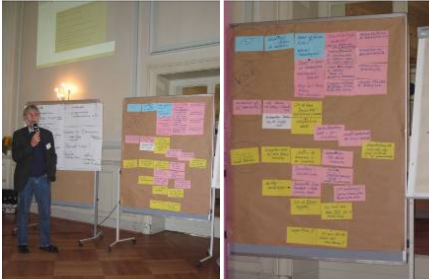
Jürgen Maier, Berichterstattung aus Workshop 1