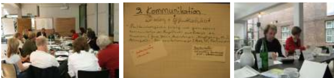
Arbeit in den Regionalkonferenzen

Die erste Staffel der Regionalkonferenzen wurde vorbereitet und durchgeführt. Die regionale Zuordnung der Ländernetzwerke wurde von der Steuerungsgruppe der BAG vorgenommen und beim Auftaktworkshop festgelegt.