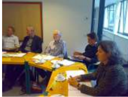
Konstituierende Projektbeirat-Sitzung