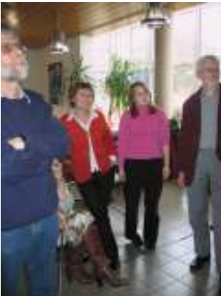
2. Regionalkonf. Mitte, Frankfurt (C. Brandt)

Die Praxisbeispiele aus den einzelnen Ländern wurden in der Regel mit einer Powerpoint-Präsentation erläutert. Aus jedem Bundesland wurde mindestens ein Vorschlag vorgestellt. Manche Bundesländer haben mehrere Praxisbeispiele präsentiert (z. B. Berlin, Rheinland-Pfalz, Hamburg). Die Aufgabe der Regionalkonferenzen war festgelegt. Die Ländervertreter sollten die Auswahlkriterien präsentieren und diskutieren sowie gemeinsam abgestimmte Projektvorschläge pro Bundesland festlegen. Des Weiteren wurden die Verträge für die Dokumentation erarbeitet und das weitere Verfahren und die Zusammenarbeit in den nächsten Projektphasen abgestimmt.