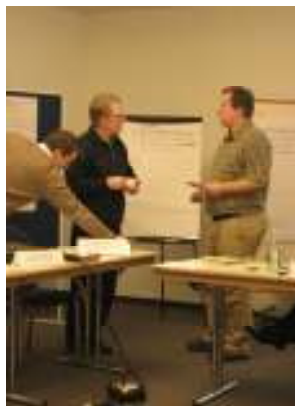
2. Regionalkonferenz Süd, Nürnberg (E. Becker)