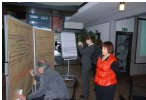
2. Regionalkonf. Nord, Hamburg