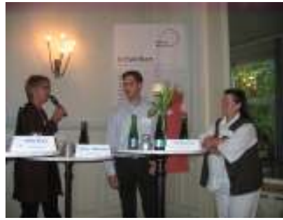
BAG-Fachkonferenz Berlin, September 2009 (P. Potz)