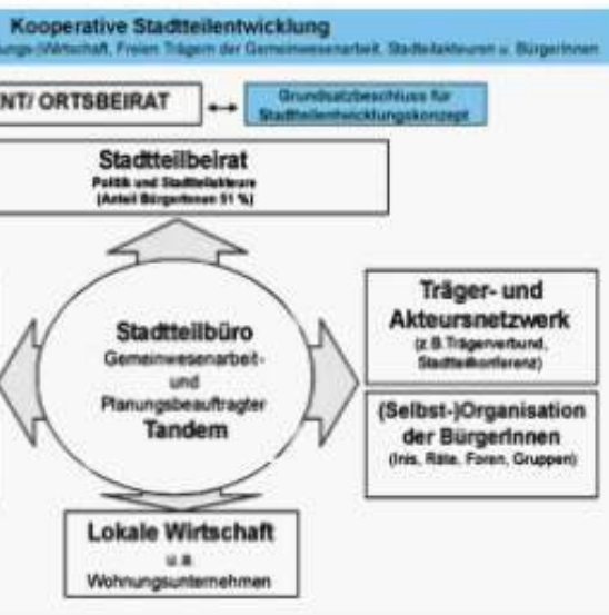
Abb. 2: Tandemkonzept als struktureller Rahmen in Programmgebieten (Thies 2005b, 96)

Aufbauend auf den Vorüberlegungen führt die Bundesarbeitsgemeinschaft (BAG) Soziale Stadtentwicklung und Gemeinwesenarbeit e.V. im Rahmen der Initiative „Nationale Stadtentwicklungspolitik“ des Bundesministeriums für Verkehr, Bau und Stadtentwicklung (BMVBS) ein Modellprojekt zur „Aktivierung von Zivilgesellschaft in der Sozialen Stadt“ 1 durch.