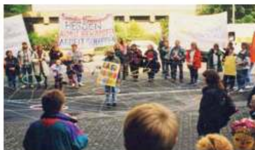
Abb. 1: „Netz-Werk“: Bewohner wehren sich gegen Einschnitte in das soziale Netz.

Die Nachhaltigkeit und Verstetigung der Sozialen Stadt über die aktuellen Förderkulissen hinaus in Regelstrukturen einzubeziehen und weiterzuentwickeln wird von der BAG als zentrale Aufgabe gesehen. Dabei gelten als Schlüsselakteure für die Verstetigung diejenigen, „die vor der Phase des Förderprogramms den Stadtteil gestaltet haben und die es nach der Phase der Sonderförderung weiter tun werden“ – Bürger, soziale Einrichtungen, Träger und Netzwerke, die lokale Wirtschaft, die zuständigen Verwaltungen und die Politik. Um die